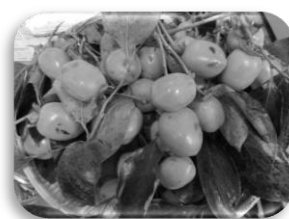
上・右：柿ちぎりの様子