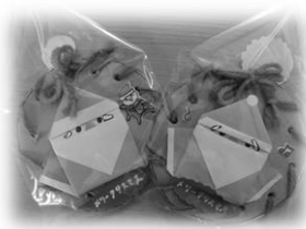
上：職員手作りの クリスマスプレゼント