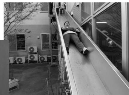
上: 滑り台を使つての訓練の様子 左: シーツを利用して避難する様子