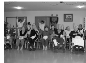
今回は白組の優勝