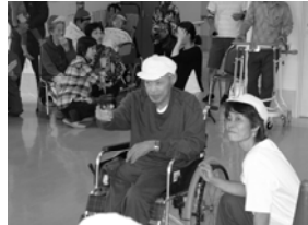
射的でGO!GO! 真剣なまなざしがすごかった。