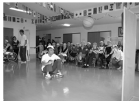
イケイケライダー