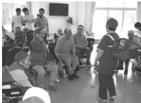
たくさん入れてね (玉入れ)

さて今月は、11月4日に開催しました運動会の話からお伝えします。先月プログラムをお伝えしましたが、参加される皆様が楽しんで頂けるよう道具や進行を職員で工夫し、賑やかに会を終了する事が出来ました。普段にない表情や動きをされる入居者も多く、楽しくも驚きのある運動会となりました。