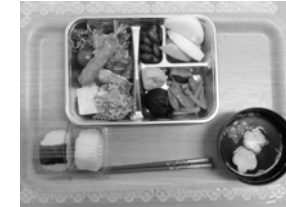
弁当は彩りよく美味しかった

今回初めて手作りの優勝カップを用意し、優勝した白組に大カップ、紅組には小カップを授与いたしました。(2階ホールに展示中)